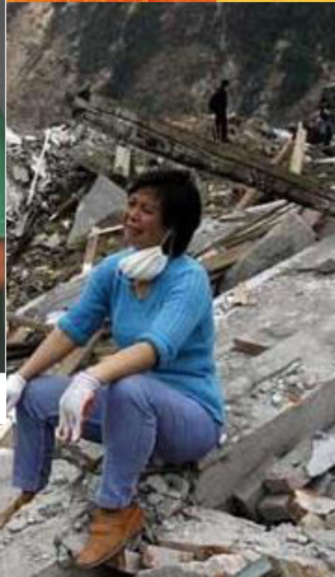
四川灾后重建房子